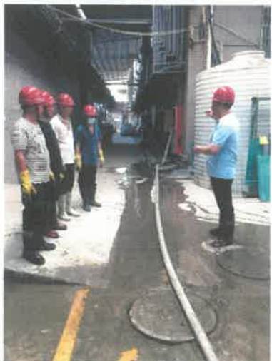
1.环保专员安排应急救援工作。