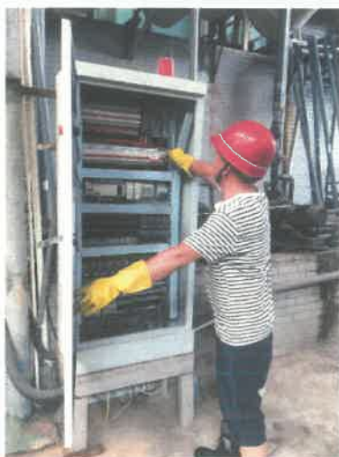
2.启动雨水收集池抽水泵开关。