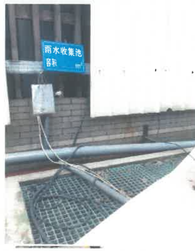
3.水泵将池内的水回收到污水站处理。