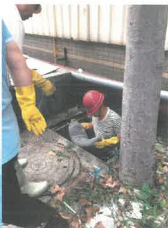
6.用沙袋加固封堵雨水口，防止废水外泄。