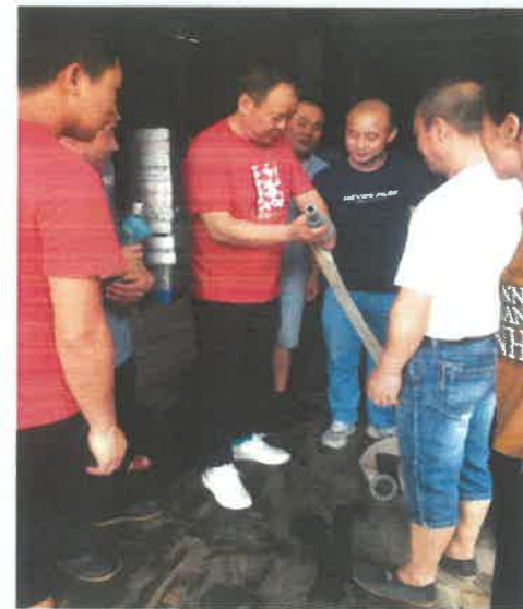
主要负责人讲解消防水枪安装