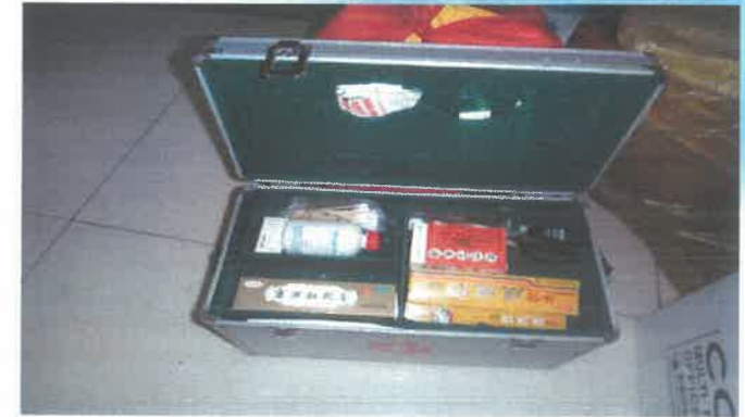
医疗药品及时到位