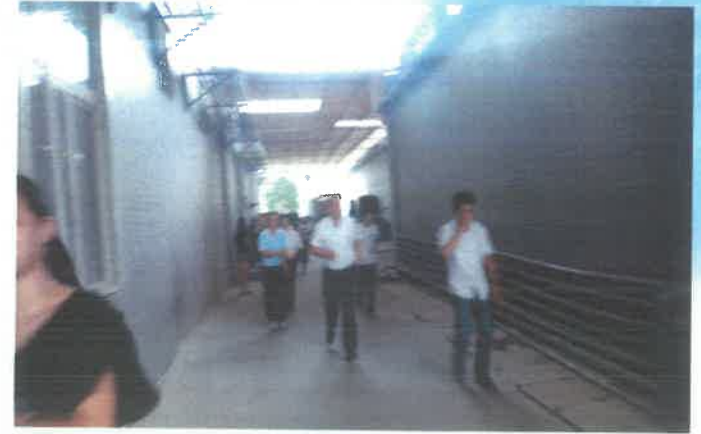
人员撤离生产车间