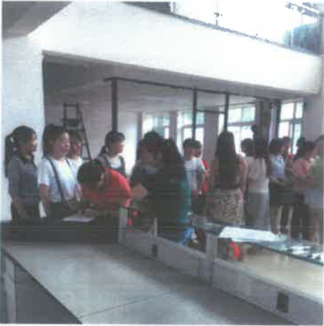
演练前总指挥动员部署