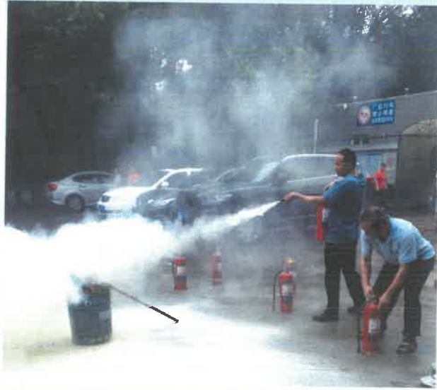
抢救消防组赶赴现场