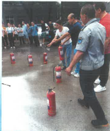
安全员讲解灭火器的使用方法