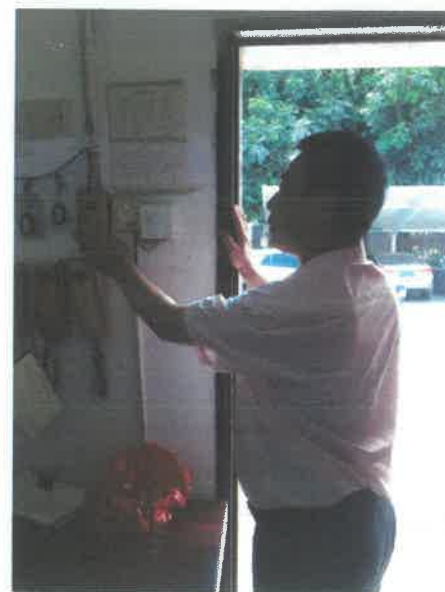
值班保安按响紧急警报